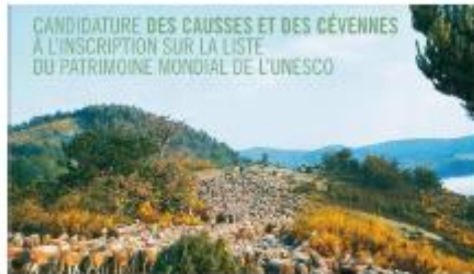
Dossier de candidature 2011