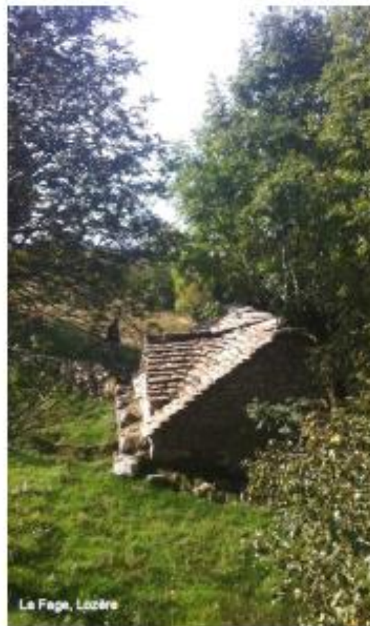
La Fage, Lozère