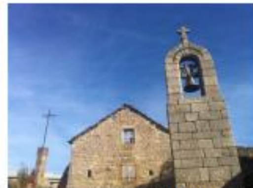
Clocher de tourmente à La Fage, Lozère