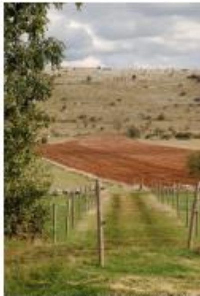
La Fichade, Causses Méjean, Lozère