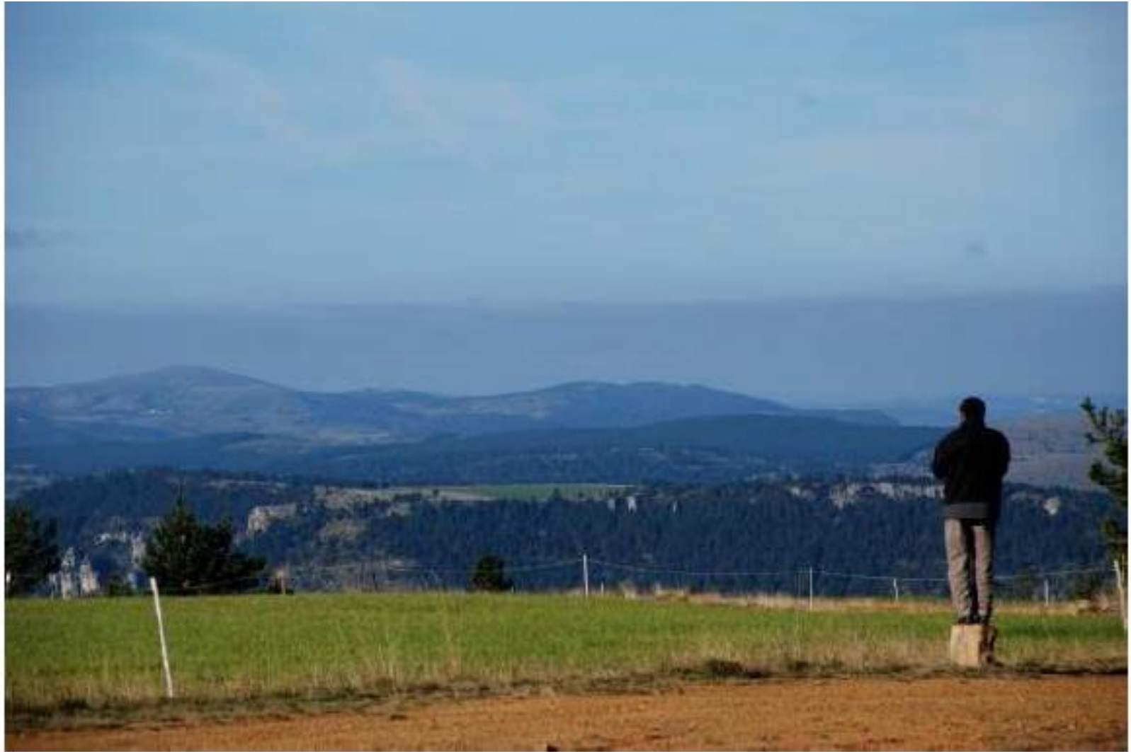
Vue du Mont Lozère